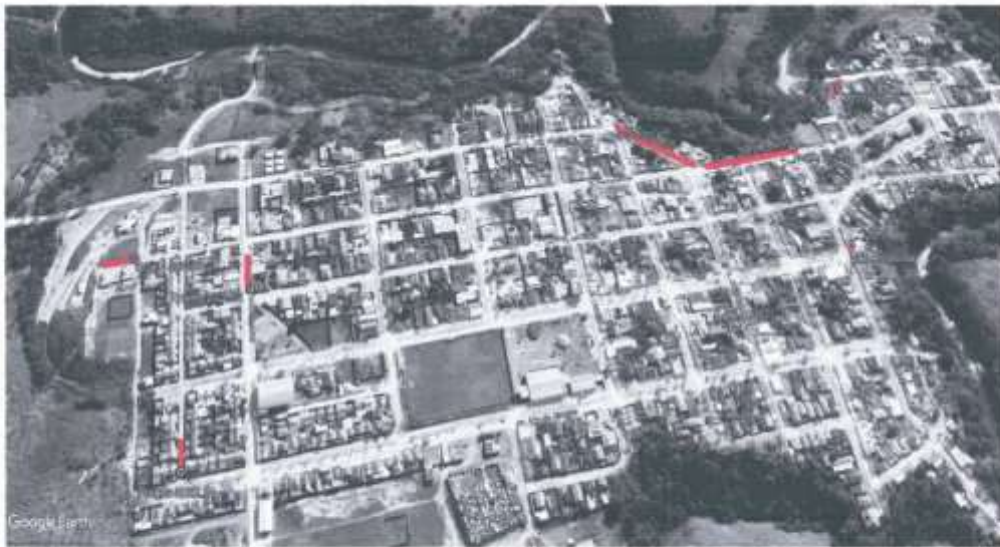
Imagem 01 – Sede de Vargem Bonita

Nos 09 locais indicados nas imagens abaixo